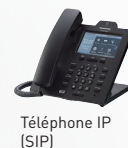
Téléphone IP (SIP)