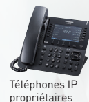
Téléphones IP propriétaires