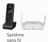
Système sans fil