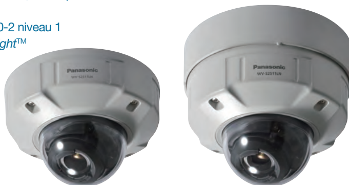
avec support de base