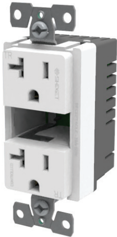
20A, 125VAC 5VDC, 2.0A NEMA 5-20R